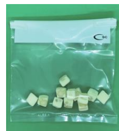
ワイヤーの先端を折って開か ないよう固定する