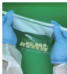
ワイヤー先端を握り、2~3回 まわし密閉する